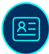
Trámites de Expedición y Renovación de Licencias