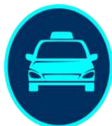
Matrículas de vehículos de Servicio Público y Particular